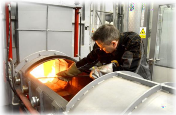
Kontinuálně pracující spalovna odpadů v poloprovozním měřítku