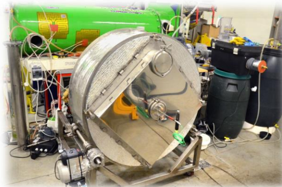
Poloprovozní anaerobní bioreaktor (fermentor)