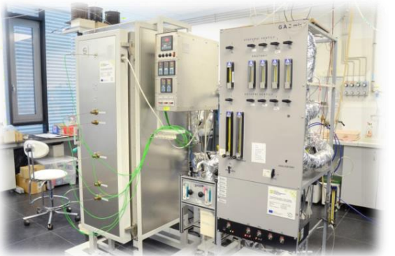
Jednotka pro testování katalyzátorů v laboratoři ochrany ovzduší