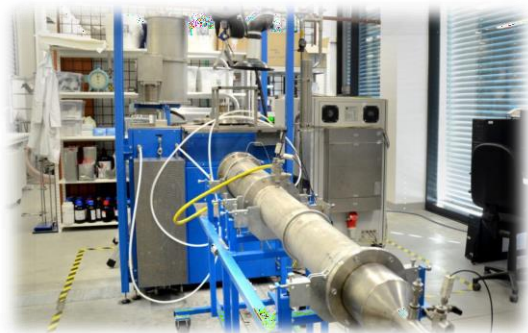
Systém pro tepelnou likvidaci nebezpečného odpadu