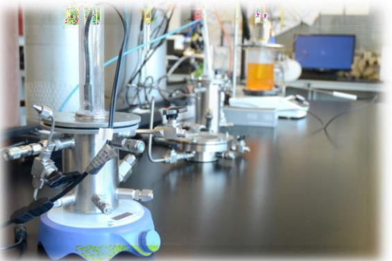
Laboratoř heterogenní fotokatalýzy